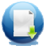
Алати за извештавање