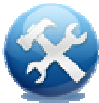
Алати за рад са картом

У горњем левом углу налази се две иконе: Алати за рад са мапом и Алати за извештавање.